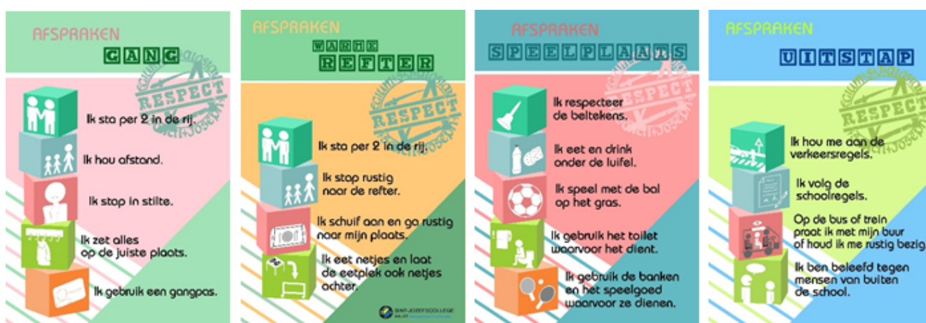
Een greep uit onze afspraken-posters

U zag de affiches wellicht in onze gangen, refters... . Ze zijn steeds eenduidig opgesteld: qua inhoud beperkt tot een 5-tal makkelijk leesbare en behapbare zinnen, bovendien ondersteund met picto's (niet in het minst om ook onze allerkleinsten aan te spreken). Als bijkomend logo staat steeds een Respect-stempel gedrukt: een, eveneens symbolische, collegestempel met de basishouding waarvan we vinden dat die overal en altijd moeten toegepast worden. Dit wordt geduid op een aparte poster.