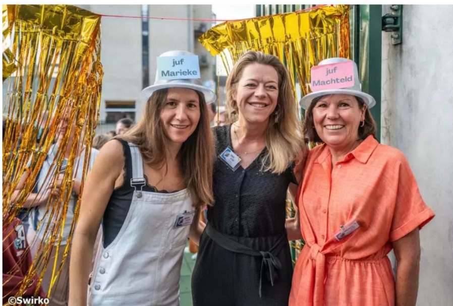
▲ SJC Pontstraat.